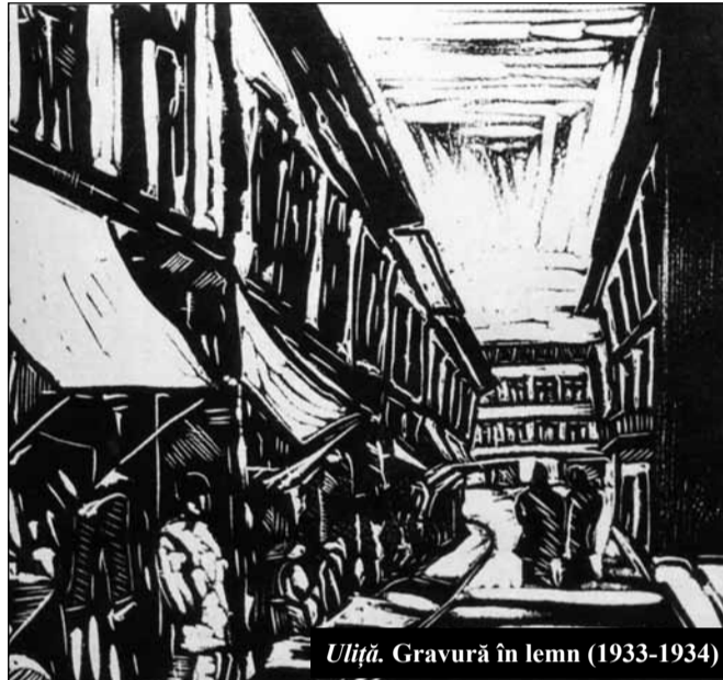
Uliță. Gravură în lemn (1933-1934)