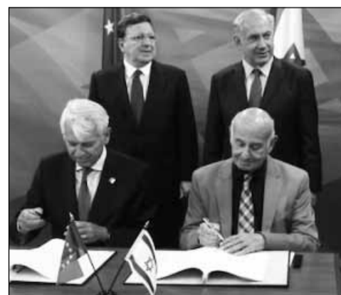
Grupaj realizat de DAN DRUȚĂ

mai mari proiecte de cooperare științifică și industrială din lume, iar Israelul va participa cu o sumă de aproximativ 140 de milioane de euro anual. În cifre absolute, cooperarea este reciproc avantajoasă, mediile științifice și economice fiind angrenate în cooperări în valoare de aproape un miliard de euro. Peste 1197 de proiecte de cercetare inițiate de oameni de știință israelieni au beneficiat de granturi europene în valoare de peste jumătate de miliard de euro. Până în prezent au fost depuse aproximativ 500 de noi proiecte, având participanți din Israel, acestea urmând a fi evaluate până în septembrie 2014 și încheiate acorduri până la finele anului. În ciuda faptului că inițial participarea la acest proiect a fost privită cu suspiciune de societatea civilă israeliană din cauza condițiilor impuse de organisme europene, cauza nobilă a cercetării și dezvoltării a primit, programul fiind considerat un demers benefic din punct de vedere politic.