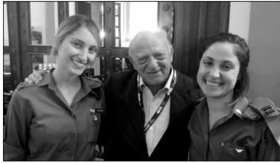
discuțiilor cu delegația WJC despre diferite aspecte concrete ale situației militare.)

În cadrul vizitei, am fost deosebit de impresionat de punctele în care se fac observații și se iau decizii, locuri unde lucrează tineri plini de maturitate și curaj. Am fost informați despre adoptarea hotărârii de a nu ceda și mai ales de implicarea forțelor armate în operațiunile militare din Gaza, pentru a distruge arsenalul de rachete aflat la dispoziția teroriștilor”. (foto: reprezentanți ai Armatei de Apărare a Statului Israel, în timpul