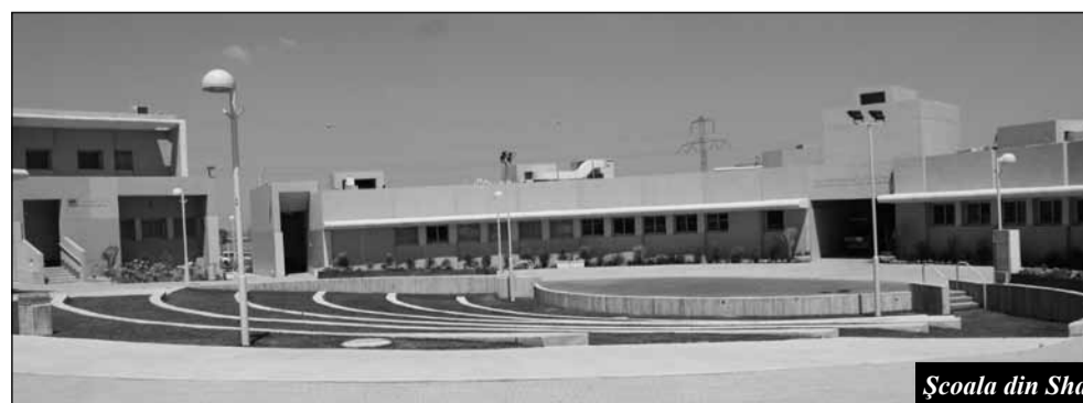
Școala din Sha'ar haNegev și adăposturile din curtea complexului

În cadrul aceleiași întâlniri cu presa evreiască din diaspora, Yuli Edelstein, președintele Knesset-ului, a explicat că el și Sharansky au devenit politicieni în Israel pentru că au vrut să sprijine cât mai mulți evrei din Rusia să vină în Israel.