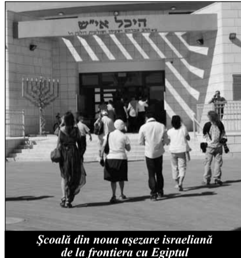
Școală din noua așezare israeliană de la frontiera cu Egiptul

mâne se plâng de efectele deșertificării din sudul țării, unde pământul e incomparabil mai bun decât în deșertul Negev!