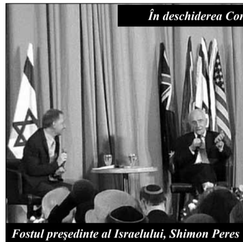
Fostul președinte al Israelului, Shimon Peres

Dintre provocările ce stau în fața Israelului, așa cum au fost ele evocate de primul-ministru, prima este cea economică, a doua este de a convinge cât mai mulți