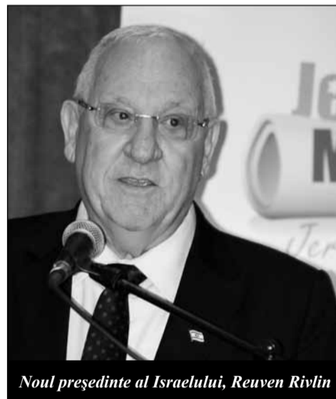
Noul președinte al Israelului, Reuven Rivlin

Răspunsul a venit de la Yigal Palmor, care i-a invitat pe ziaristi în Israel, pentru că au subiecte interesante, dar fiecare, în zona lui, trebuie să aleagă subiectele care îi interesează pe propriii cititori, în funcție de situația din țara de origine. „Există acum (25 iunie, când încă se spera găsirea în viață a celor trei adolescenți răpiți – n. red) un mare interes pentru răpirea celor trei tineri, dar acest interes nu e la fel de mare în Africa, unde sute de fetițe sunt răpite, fără să se mai știe vreodată