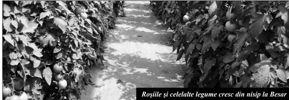
Roșiile și celelalte legume cresc din nisip la Besor