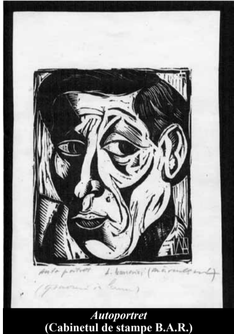
Autoportret (Cabinetul de stampe B.A.R.)

Filmul acelor împrejurări de groază avea să-l desfășoare însuși artistul plastic într-un dialog cu literatul Lucian Boz, imediat după întoarcerea sa din Franța,