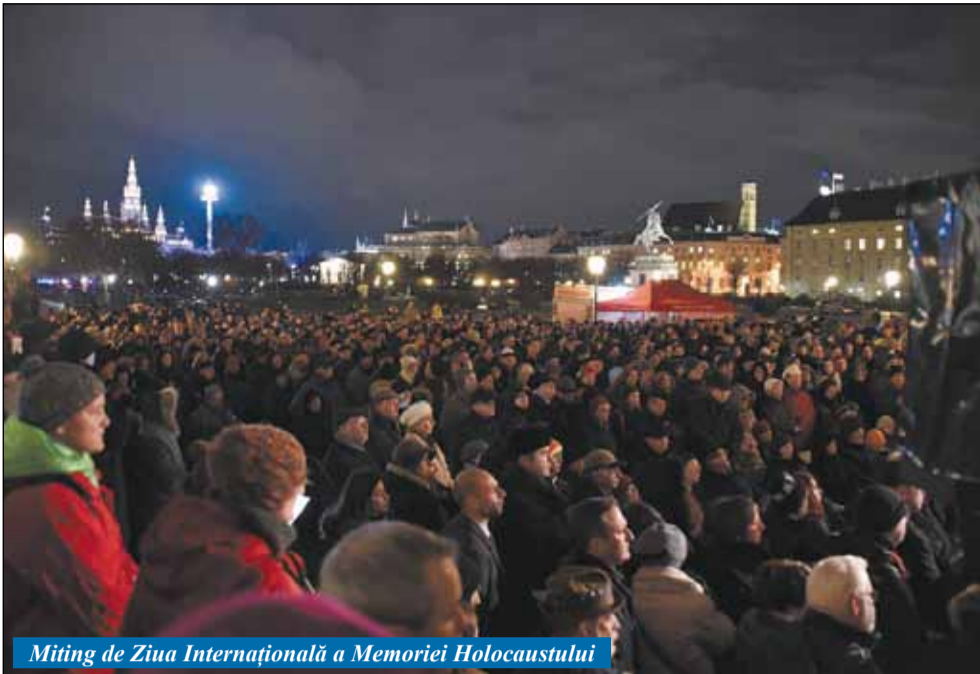
Miting de Ziua Internațională a Memoriei Holocaustului

Cu 11 ani în urmă, 27 ianuarie a fost declarată Ziua Internațională a Memoriei Holocaustului ( International Holocaust Remembrance Day ), printr-o rezoluție (60/7 1 noiembrie 2005) a Adunării Generale a ONU. Propunerea de a alege o zi internațională dedicată memoriei Holocaustului a aparținut