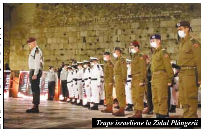
Trupe israeliene la Zidul Plângerii

Agenția Evreiască, în colaborare cu WZO, JNF, Keren Kayesod, JFNA și JFC, a organizat comemorarea a 60 de ani de la scufundarea vasului Egoz având la bord 44 de evrei marocani în drum spre Israel, misiune secretă