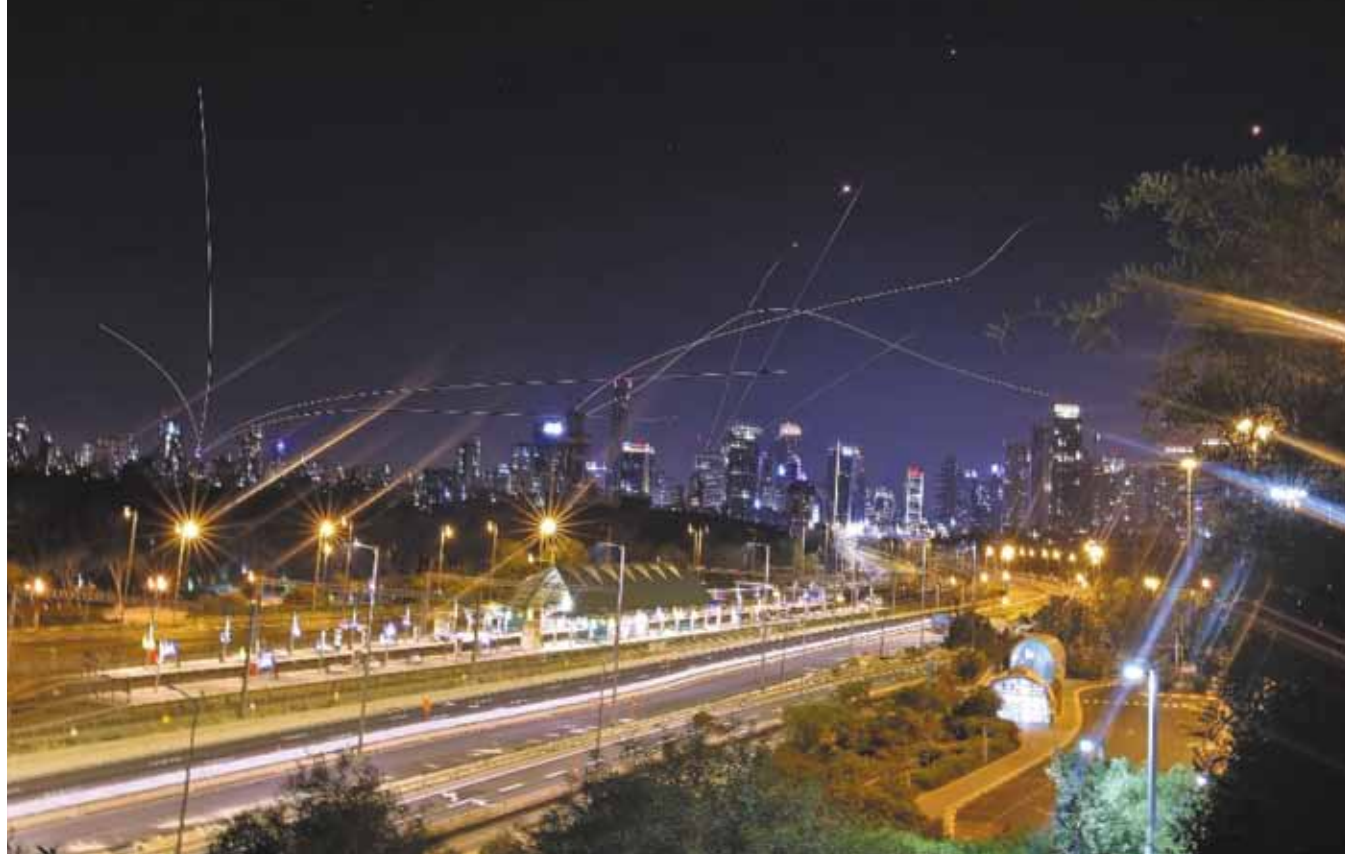
Rachetele palestiniene distruse de sistemul de apărare israelian desupra Tel Avivului