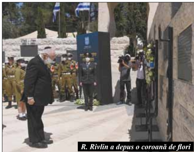
R. Rivlin a depus o coroană de flori

În dimineața următoare, după Shahrit , prim-rabinul Shraya Kav, luptător în Războiul de Șase Zile din '67, a împărtășit participanților un episod