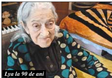
Lya la 90 de ani

Pe istoricul Lya Benjamin nu cred că este cazul să o prezint cititorilor noștri. Cei mai mulți membri ai comunităților evreiești, dar nu numai ei, ci și numeroase personalități ale societății civile știu cine este și ce face. Totuși m-am gândit că, în cele nouă decenii de viață, au fost momente, întâmplări, amintiri pe care nu le-a împărtășit celor din jur și că acum a venit momentul să ne vorbească despre câteva dintre ele, mai apropiate de sufletul său.