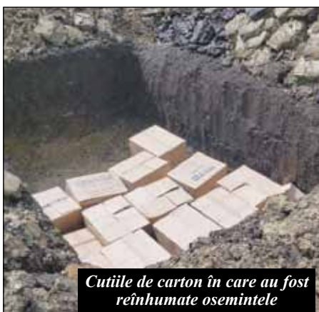
Cutiile de carton în care au fost reînchinate osemintele