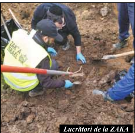
Lucrători de la ZAKA