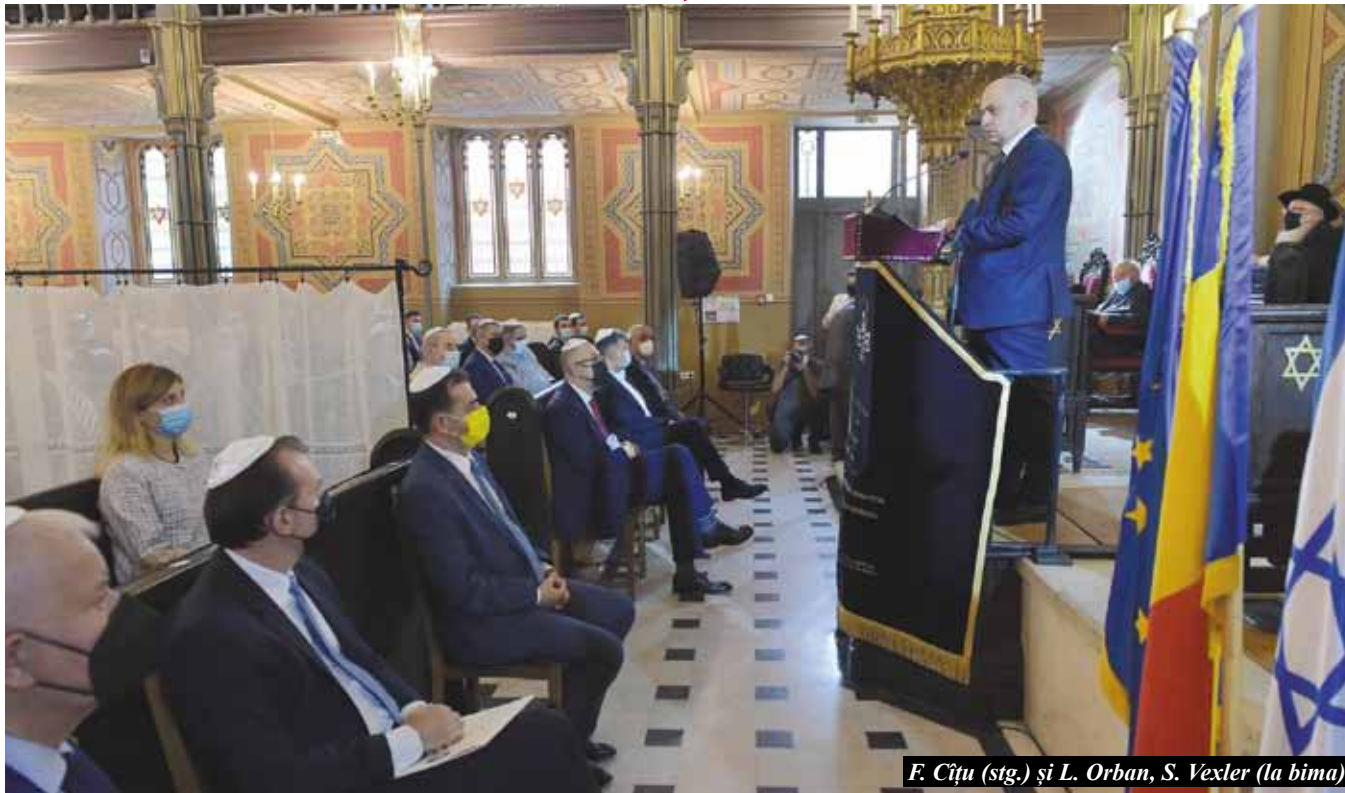
F. Cîțu (stg.) și L. Orban, S. Vexler (la bima)