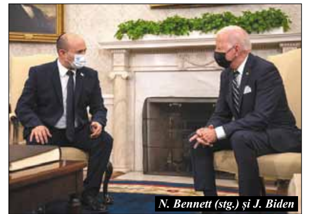
N. Bennett (stg.) și J. Biden

Președintele Biden a vorbit despre relațiile apropiate pe care le-a avut cu o serie de premieri israelieni și a salutat stabilirea de către Israel