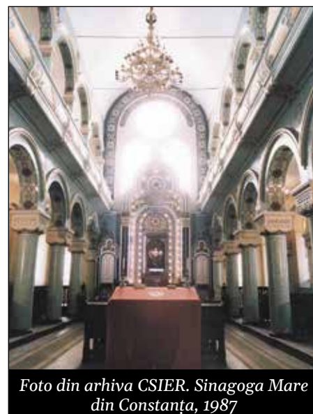
Sinagoga Mare din Constanța, 1987