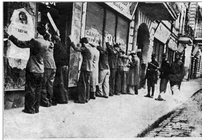
Pe strada I. C. Brătianu, în dreptul casei cu No. 157, grup de evrei ținându-și la zid, cu mâinile ridicate, păziți de soldați, dintre cari unul în haine civile, dar cu boneta militară.